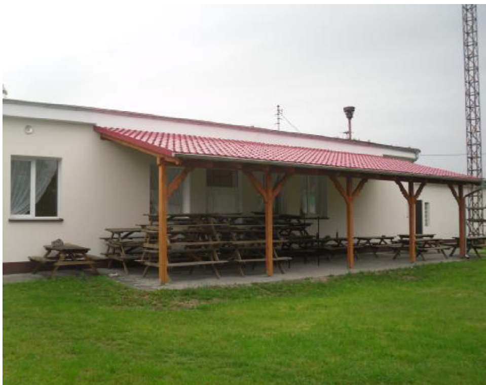
Zadaszenie przy świetlicy wiejskiej.