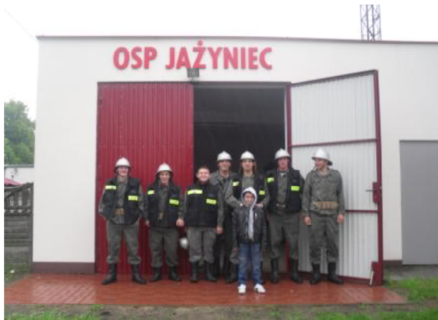
Strażacy ochotnicy przy remizie OSP.

Przy budynku, w którym mieści się świetlica wiejska, zlokalizowana jest remiza Ochotniczej Straży Pożarnej. W roku 2013 remiza została wyremontowana.