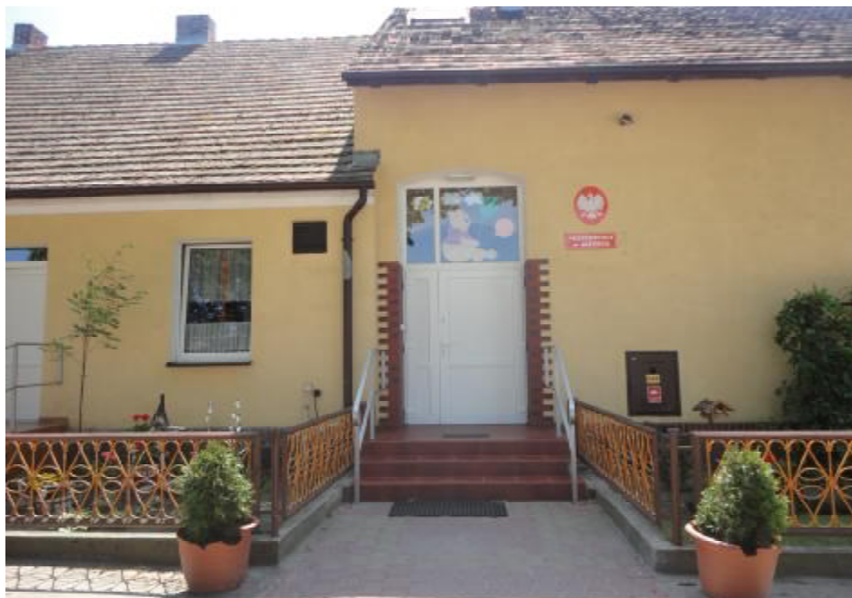
Wejście do przedszkola.

W Jażyncu funkcjonuje publiczne przedszkole, do którego uczęszczają miejscowe dzieci oraz dzieci z Żodynia. Szkoła podstawowa i gimnazjum dla dzieci z terenu Jażynca znajduje się w pobliskiej miejscowości w Obrze.