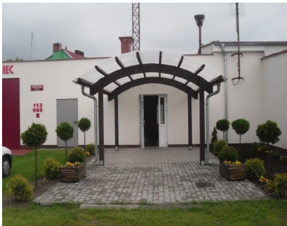
Wejście do świetlicy wiejskiej.