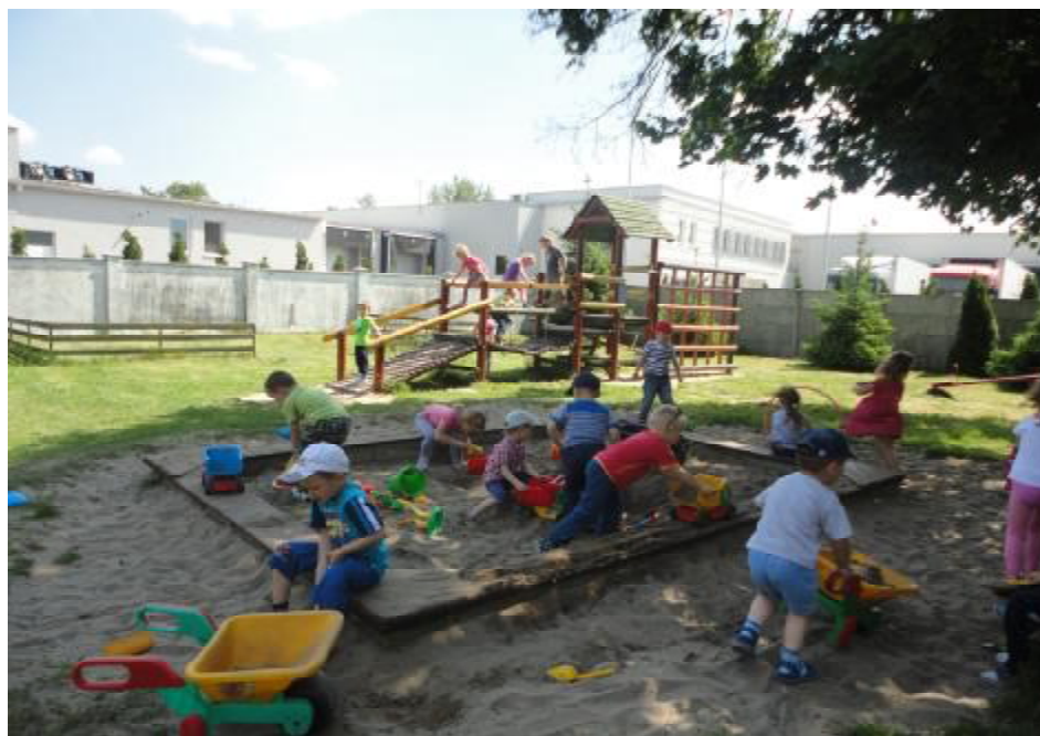
Dzieci bawiące się na placu zabaw przy przedszkolu.

Przedszkole działa również podczas wakacji, w ramach akcji „Zielone przedszkole”. Przedszkolacy mogą wówczas uczestniczyć w różnych przygotowywanych dla nich atrakcjach, takich jak np. wyjazdy nad jezioro, do ZOO, do gospodarstw agroturystycznych itp.