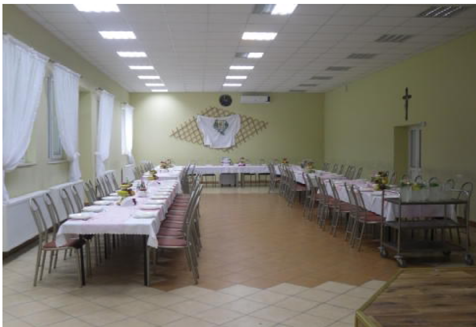
Świetlica wiejska przygotowana do uroczystości.