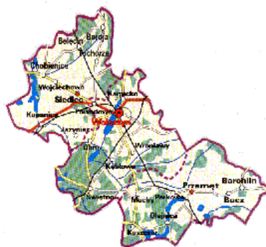
Mapa powiatu wolsztyńskiego.

Powierzchnia ogólna Gminy wynosi 20 506 ha co daje 24 miejsce pod względem wielkości w województwie wielkopolskim. Obszar Gminy stanowi 29,8 % obszaru powiatu wolsztyńskiego i 0,7 % obszaru województwa wielkopolskiego.