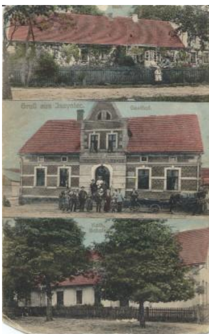
Na starej fotografii pozdrowienia z Jażyńca

Na przestrzeni wieków wieś nosiła różne nazwy: Jazieniec, Jasieniec, Jażdżyniec, a obecnie Jażyniec.