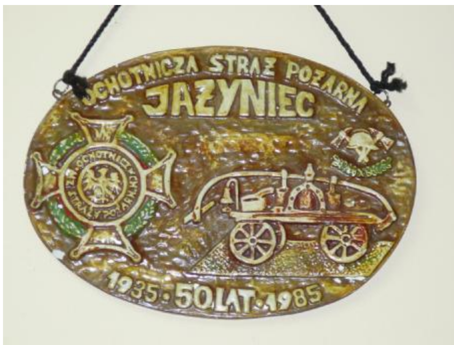
Pamiątkowy emblemat wykonany z okazji 50 rocznicy istnienia OSP

Nad bezpieczeństwem mieszkańców miejscowości czuwają strażacy ochotnicy z Jażyńca oraz inne jednostki OSP z terenu Gminy Siedlec. Tradycje związane z pożarnictwem w Jażyńcu sięgają roku 1935. Na ten czas datuje się powstanie jednostki Ochotniczej Straży Pożarnej. Jednostka ta jest obecnie jedną z 15-u jednostek OSP na terenie Gminy. Skupia ponad 30 członków. Jednostka nie dysponuje własnym samochodem strażackim, jednakże na wyposażeniu remizy są węże gaśnicze i inny niezbędny sprzęt gaśniczy. Należy wspomnieć, iż jednostka posiada zabytkową sikawkę konną używaną przed laty do gaszenia pożarów.