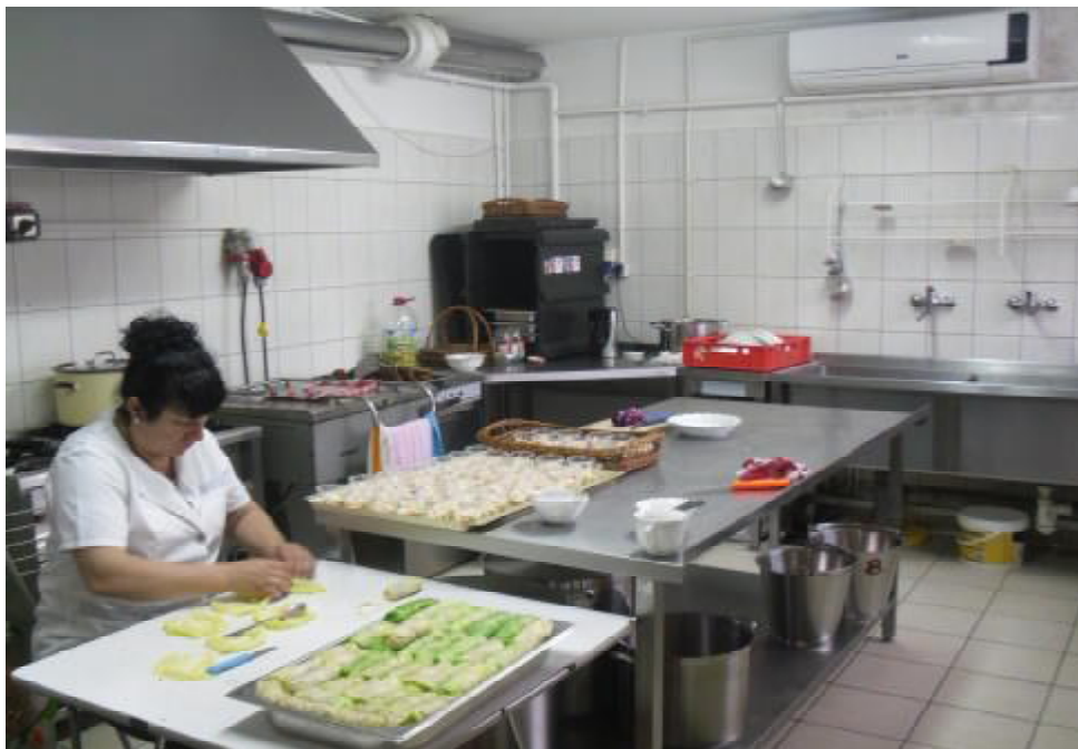
Prace w kuchni.

Poniżej fotografie świetlicy wiejskiej w Jażyncu.