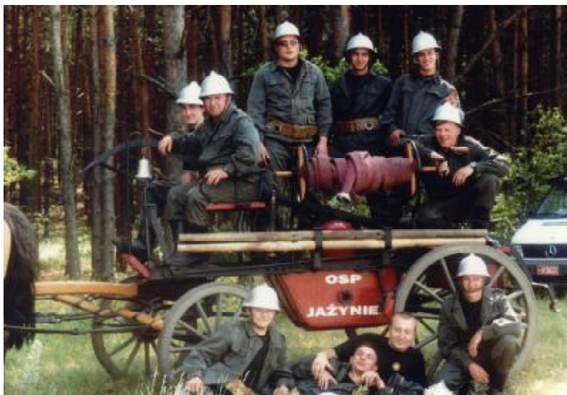
Załoga sikawki konnej.