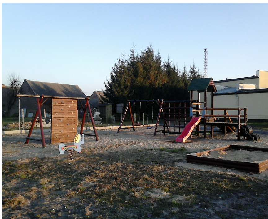
Plac zabaw przy remizie OSP

We wsi znajdują się trzy place zabaw – przy szkole, remizie OSP oraz na „Nowym Osiedlu”.