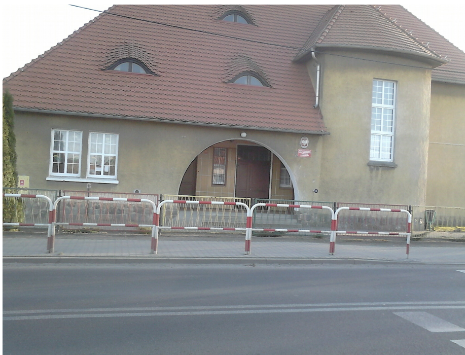
W budynku szkolnym w jednym z pomieszczeń jest biblioteka

W jednym z pomieszczeń szkolnych znajduje się biblioteka gminna.