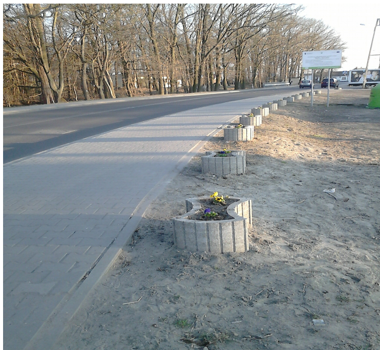
Posadzone bratki w gazonach wiejskich – marzec 2014

Tak jak to bywało wcześniej planuje się wiosenne sprzątanie centrum miejscowości oraz parku. W celu ukwiecenia wsi corocznie posadzone zostaną kwiaty w gazonach wiejskich.