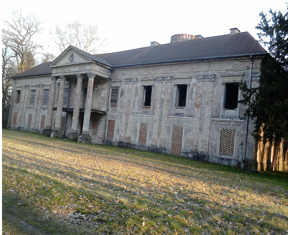
Obecny wygląd pałacu

Pałac jest wpisany do rejestru zabytków. Według raportu Wielkopolskiego Konserwatora Zabytków w Poznaniu z 2004 roku, pałac w Chobienicach stanowi przykład barokowego budownictwa rezydencjonalnego na terenie Wielkopolski i jest najcenniejszym zabytkiem na terenie gminy Siedlec, stąd konieczna opieka nad nim i całym kompleksem pałacowo-parkowym.