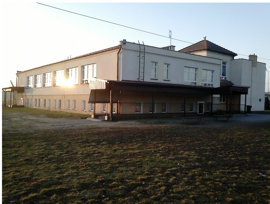
Jeden z budynków szkolnych

Na terenie miejscowości jest przedszkole, szkoła podstawowa oraz gimnazjum działające jako Zespół Przedszkola, Szkoły Podstawowej i Gimnazjum. Placówka mieści się w trzech budynkach.