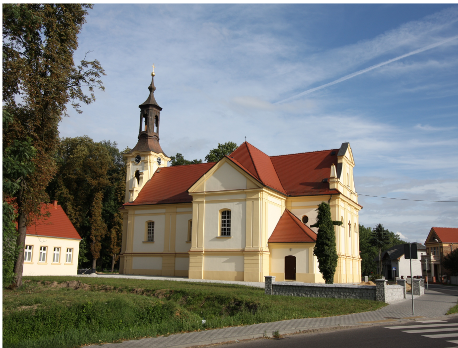
Kościół pw św Piotra w Okowach