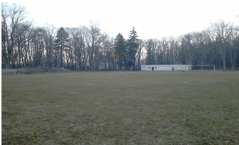
Boisko LZS „Sokół-Orkan” Chobienice

Do dyspozycji zawodników i mieszkańców jest także boisko „ORLIK”.