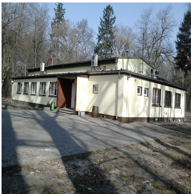
Widok świetlicy: od frontu