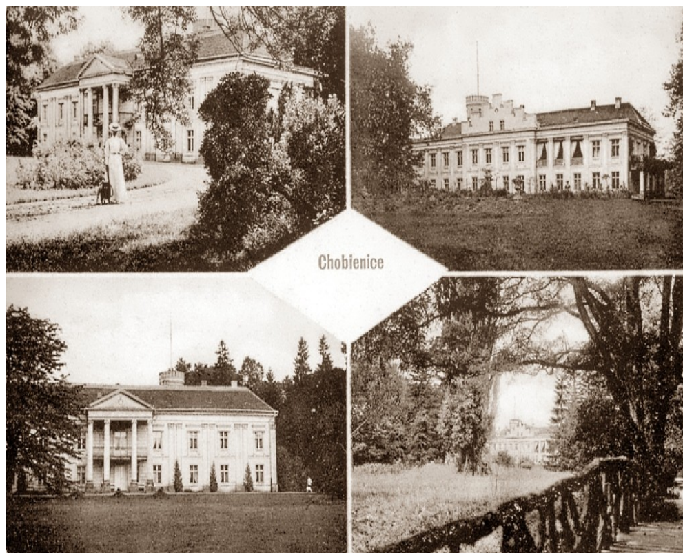
Tak pałac wyglądał gdy właścicielami byli Mielżńscy

W XVIII wieku hrabia Józef Mielżyński - wojewoda poznański a później kaliski zbudował pałac w stylu późnobarokowym. Na początku XIX wieku pałac został znacznie rozbudowany i otrzymał wygląd klasycystyczny poprzez dobudowanie przed nim czterokolumnowego portyku z herbem Mielżyńskich i wymownym napisem „ Nie sobie lecz następcom ”. Poza portykiem dobudowano wówczas trakt wzdłuż fasady ogrodowej, balkon na pięciu kolumnach od strony wschodniej, a od strony zachodniej balkon żelazny (na słupach żelaznych i z żelazną balustradą). Pod koniec XIX wieku dobudowano neogotycką cylindryczną wieżyczkę wystającą ponad dach, zwieńczoną kręzelokiem, z okrągłymi otworami strzelniczymi.