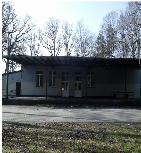
od strony tarasu

We wsi znajdują się trzy place zabaw – przy szkole, remizie OSP oraz na „Nowym Osiedlu”.