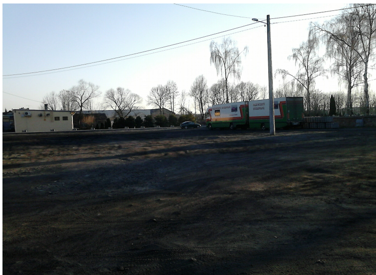
Marzec 2014 – tak wygląda plac gdzie ma powstać parking

Inwestycja polegać będzie na budowie utwardzonego parkingu o powierzchni 2.392 m 2 , z 68 miejscami postojowymi o wymiarach 2,50 x 5 m oraz trzema miejscami postojowymi o wymiarach 3,60 x 5 m dla samochodów osób niepełnosprawnych i drogami manewrowymi o szerokości 5 m. Parking będzie połączony z głównym wejściem do cmentarza ciągiem pieszym o długości 13 m. Parking będzie wyłożony kostką brukową betonową. Posadzona zostanie zieleń – pas zieleni izolacyjnej o szerokości zmiennej wokół parkingu, to jest ułożenie warstwy ziemi roślinnej z obsianiem mieszkanką traw(poza odcinkiem istniejącego chodnika stanowiącego dojeżdżenie do cmentarza). Przyjęte przez projektanta rozwiązania techniczne powodują, że projektowany obiekt będzie miał charakter nieuciążliwy dla środowiska. Realizacja tej inwestycji zaspokoi potrzeby mieszkańców i przyjezdnych oraz wpłynie korzystnie na wygląd centrum miejscowości.